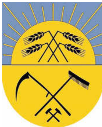
Vorschlag für das (unveränderte) Ortsteil-Signet von Härtensdorf

Seit Februar 1947 führte die damals selbständige Gemeinde Härtensdorf das folgende Wappen, das auch weiterhin als Ortsteil-Signet für Härtensdorf vorgeschlagen wird.