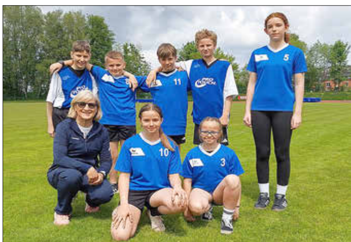
Textverfasser und Bildrechte: Frau Anja Gnüchtel / Lehrerin OS Hartenstein

Das Sportlehrerteam der Oberschule Hartenstein