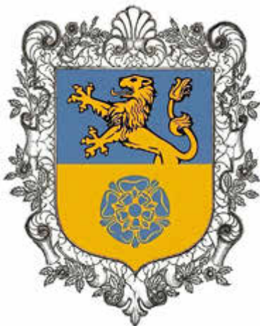
Vorschlag für das Ortsteil-Signet von Wildenfels

Der Vorschlag für das Ortsteil-Signet von Wildenfels zeigt – anders als im Wildenfeser Stadtwappen – unten eine blaue Rose, und das gesamte Signet wird von einem Rankenwerk umrahmt. Die Umrahmung wurde gewählt, damit sich das Wildenfeser Signet deutlich vom geschützten Stadtwappen unterscheidet.