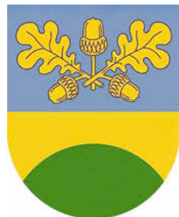
Vorschlag für das Ortsteil-Signet von Wiesen

Im Vorschlag für das Ortsteil-Signet von Wiesen ist im oberen Bereich ein stilisierter Eichenzweig mit drei Eicheln zu sehen. Er soll den ehemaligen Gasthof „Zu den drei Eichen“ (Schneeberger Straße 12) symbolisieren, der vor Jahrhunderten aus dem nördlichsten Bauerngut von Wiesen hervorgegangen ist. Der grüne Halbbogen in der unteren Hälfte verweist auf grüne Wiesen.