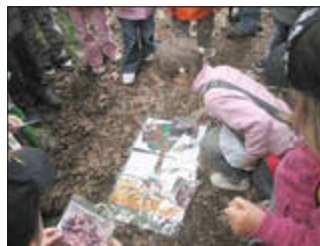
Foto: Zuordnung der Tiere zu den Schichten des Waldes am Baum

„Alle hängen voneinander ab – Lebensgemeinschaft Wald“