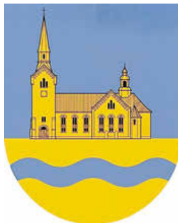
Vorschlag für das Ortsteil-Signet von Schönau

Im Vorschlag für das Ortsteil-Signet von Schönau ist im oberen Bereich die stilisierte St.-Rochus-Kirche zu Schönau in Gold auf blauem Grund zu sehen. Unten ist die Zwickauer Mulde dargestellt, die auf Schönauer Flur liegt.