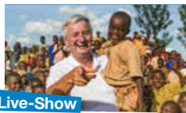
Live-Show mit Reiner Meutsch