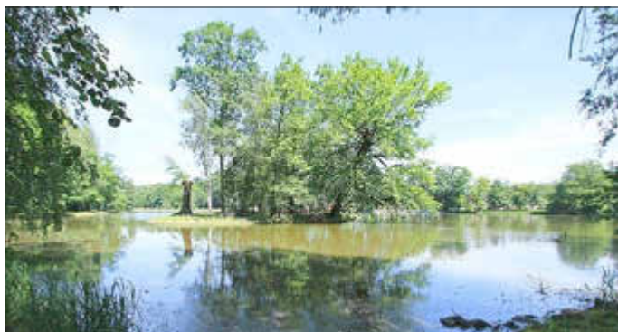
Schwanenteich in Waldenburg

Infos unter www.graefenmuehle.de/veranstaltungen oder 03762 75935 0