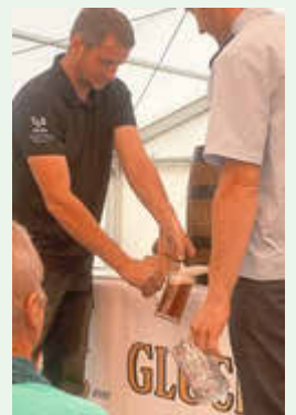
Juni 2025 - Festveranstaltung 875 Jahre Kirchgemeinde Härtsendorf