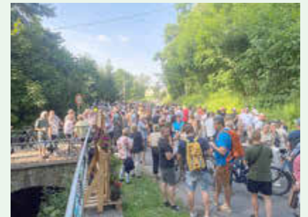
Juni 2025 - Kneipentour zur Kirchgemeindefeier