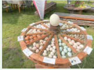
Juni 2025 - Mühlentag in Schöna u und Wildenfels - Schöna uer Mühle