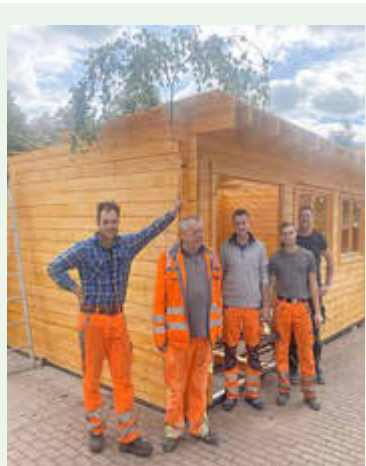
September 2025 - Herstellung neuer Nutzflächen und Errichtung Holzhaus im Kindergarten Rainbow Wildenfels