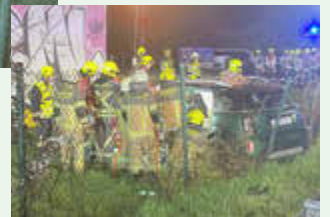
18.04.2025 - schwerer Verkehrsunfall auf der A72