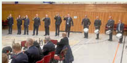
24.01.2025 - Eröffnung der JHV der Feuerwehren der Stadt Wildenfels in der MZH durch unseren Signalzug