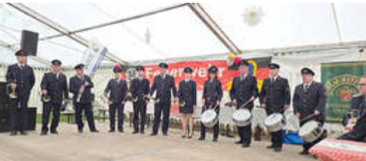
August 2025 - Festveranstaltung 150 Jahre Feuerwehr Wildenfels