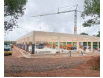
August 2025 - Bau von Krämer Pferdesport im Gewerbegebiet Wildenfels begonnen