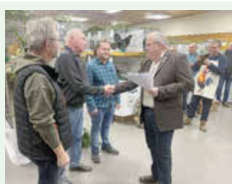
21.11.2025 - Eröffnung Geflügelausstellung in Wiesenburg