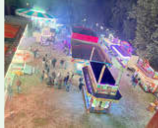
Juni 2025 - Parkfest Wildenfels