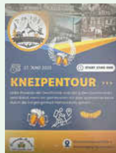
Juni 2025 - Kneipentour zur Kirchgemeindefeier