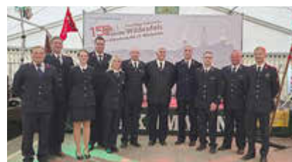
August 2025 - Festveranstaltung 150 Jahre Feuerwehr Wildenfels