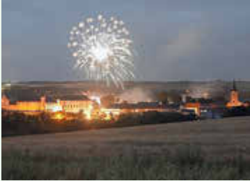
Juni 2025 - Feuerwerk zum Parkfest Wildenfels