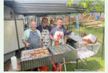
Juni 2025 - Mühlentag in Schöna u und Wildenfels - Schöna uer Mühle