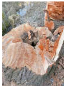
Februar 2025 - Baumschnitt und Pflegemaßnahmen - Goldbachgrund Wiesenburg