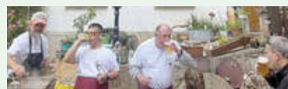
Juni 2025 - Mühlenfest Teichmühle Wildenfels