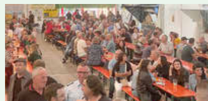
Juni 2025 - Festveranstaltung 875 Jahre Kirchgemeinde Härtsendorf