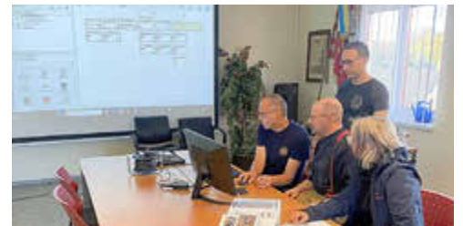
25.10.2025 - Kommunikationsübung der Feuerwehren der Stadt Wildenfels