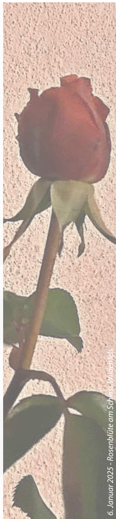
6. Januar 2025 - Rosenblüte am Schloss Wildenfels