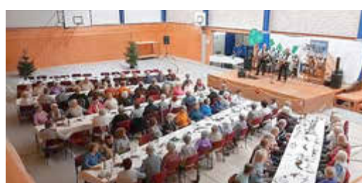
Dezember 2025 - Seniorenweihnachtsfeier