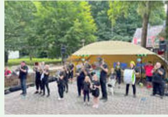
Juni 2025 - Parkfest Wildenfels -