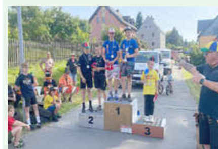
14.06.2025 - Bobbycarrennen in Wiesen