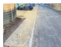
15.12.2025 - Fertigstellung grundsätzlicher Ausbau Lindenstraße in Wiesenburg