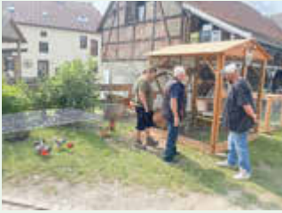
Juni 2025 - Mühlentag in Schöna u und Wildenfels - Schöna uer Mühle