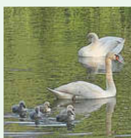
Juni 2025 - Schwäne mit Nachwuchs