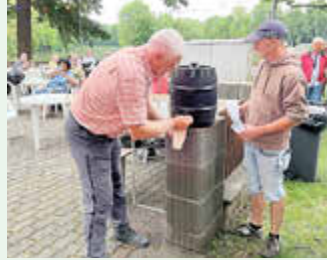
Juni 2025 - Parkfest Wildenfels