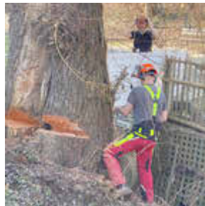
Februar 2025 - Baumschnitt und Pflegemaßnahmen - Goldbachgrund Wiesenburg