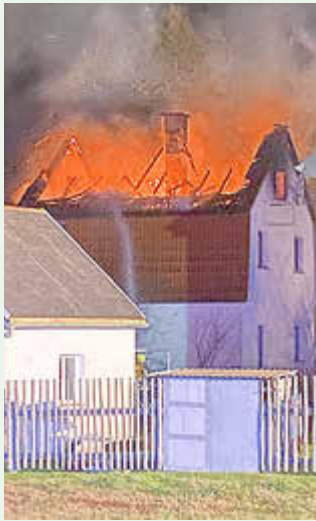
1. Januar 2025, 05:30 Uhr - Brand eines leerstehenden Wohnhauses in Weißbach