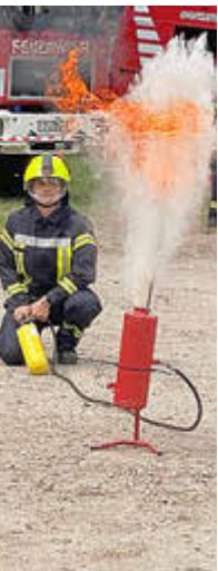
August 2025 - 150 Jahre Feuerwehr Wildenfels