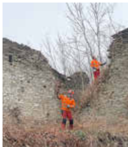
Februar 2025 - Baumschnitt und Pflegemaßnahmen - Beseitigung von Wildwuchs Schloss Wiesenburg