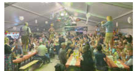
August 2025 - Festveranstaltung 150 Jahre Feuerwehr Wildenfels