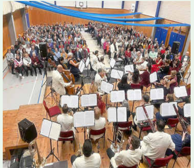
25.01.2025 - Neujahrskonzert mit der Vogtland Philharmonie in der MZH