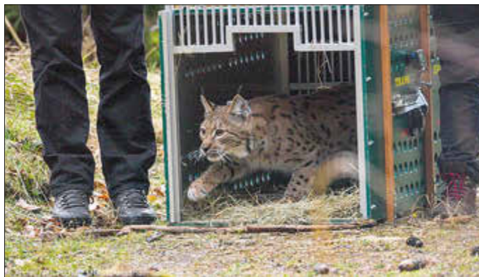
„Die Luchsin Alva verlässt ihre Kiste in die Freiheit.“