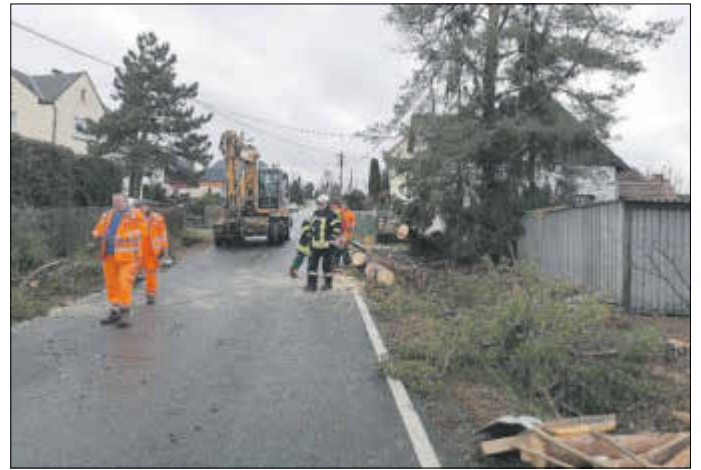
Sturmschaden Kirchberger Str. in Wiesen - 10.02.20