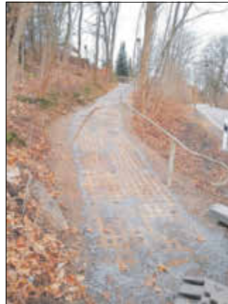
Weg fertiggestellt – Blick von Ernst-Schneller-Str.