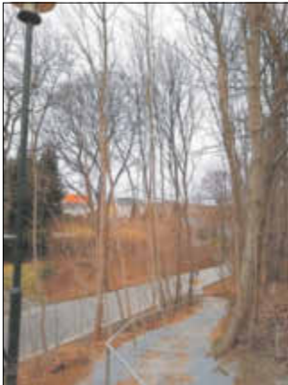
Weg fertiggestellt – Blick auf Ernst-Schneller-Str.