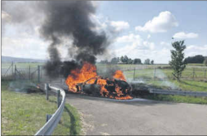
Pkw-Brand A72 - 07.09.20

Vielen Dank, dass ihr zu jeder Tages- und Nachtzeit für uns und andere da seid!