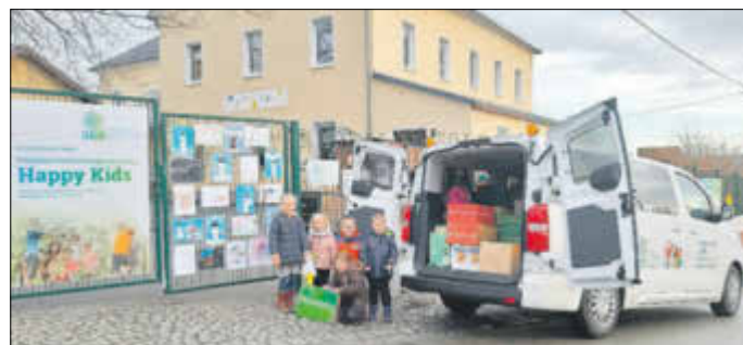
Kinder der Happy Kids