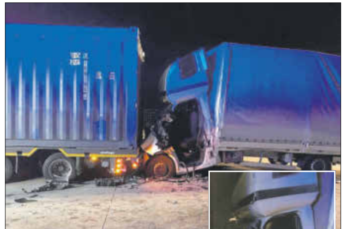
Eingeklemmte Person A72 - 06.05.20