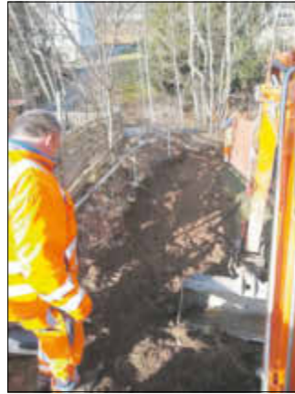
Weg vor Beginn der Bauarbeiten