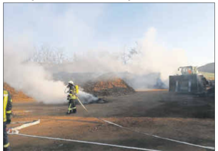
Brand im Kompostwerk Schönau - 02.04.20