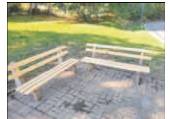
Bänke vor ehem. Gemeindeamt Wiesenburg 1

Dafür haben wir im Sägewerk das während der Baumfällarbeiten der zurückliegenden Jahre nutzbare geschlagene Holz zu Brettern und Pfosten schneiden lassen. Gerade das Holz unserer Robinien eignet sich hervorragend zur Nutzung für Spielgeräte oder auch für die Aufarbeitung von Sitzgelegenheiten im Stadtgebiet. Die Verwendung von einheimischen Hölzern liegt uns besonders am Herzen, schließlich wäre eine Verwendung nur als Brennholz einfach zu schade!