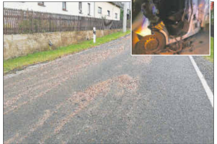
Kirchberger Str., Wiesen nach Starkregen - 26.07.20