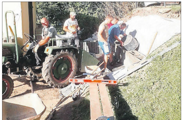
Der neue Grillplatz auf der dritten Terrasse nimmt Gestalt an.

Die „Mannschaft vom Grill“ schuf sich eine neue Grillecke, die nun einem Pavillon Platz- und Standsicherheit gewährleistet und brandschutztechnisch sicherer ist.