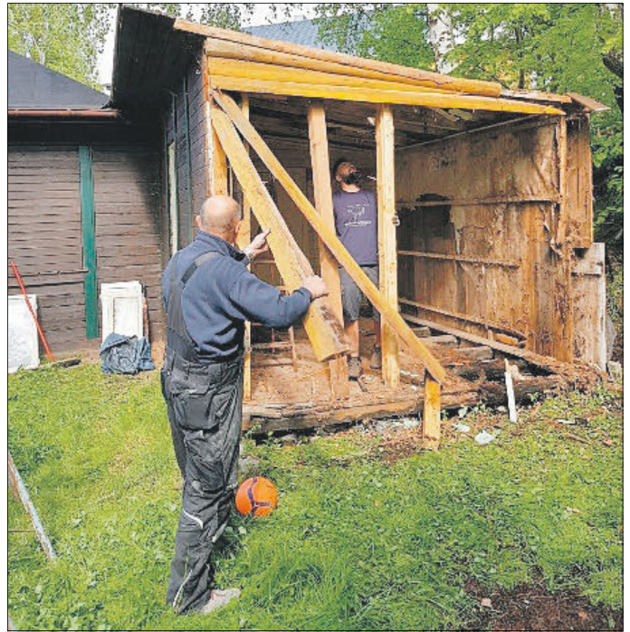
Abriß des südlichen Teils des Spartenheims auf der zweiten Terrasse.

maligen Gasthof „Drei Eichen“ in Wiesen und hatte nun endgültig seine Grenznutzungsdauer erreicht!