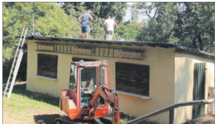
Mitglieder des Feuerwehrvereins „können auch Dachdecker“.

Das Dach des Gebäudes auf der dritten Terrasse musste dringend wieder regensicher gemacht werden.