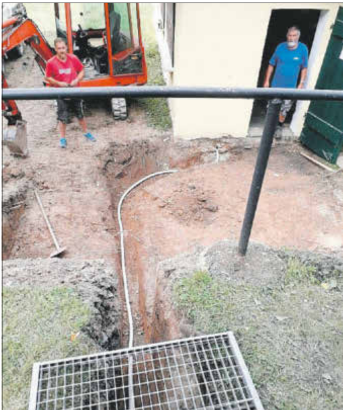
Mitglieder des Feuerwehrvereins erbrachten 2019 Eigenleistungen bei der Erneuerung der Elektroanlage.