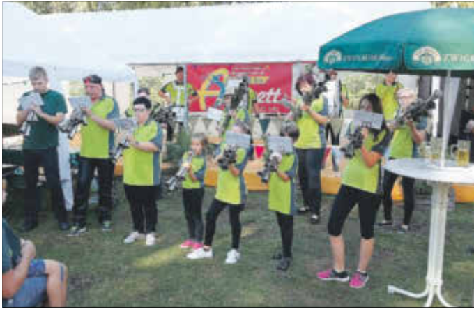
Wildenfelser Schalmeien eröffnete den Frühschoppen am 15. September 2019.