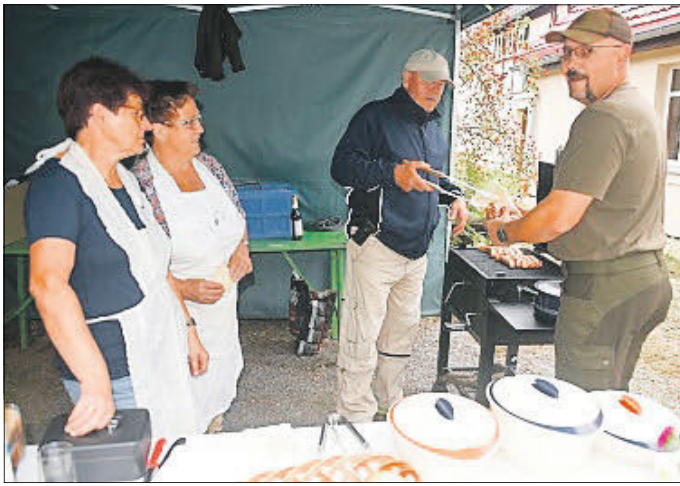
Die Grillmeister hatten den ganzen Tag viel Kundschaft.