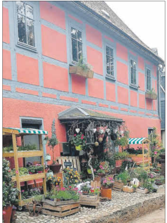
Historischer Gasthof zum Weißen Hirsch in der Lindenstraße 18 in Wiesenburg

seit 2015 ein Blumengeschäft, das mit beachtlichen Kreationen der Blumenkunst hervorsteicht.