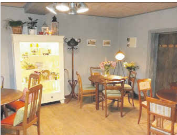
Blumen-art-Café Wiesenburg in der historischen Gaststube zum Weißen Hirsch

Nach 60 Jahren lädt die Gaststube der Restauration „Weißer Hirsch“ seit Mai 2019 wieder zum Verweilen ein. In stilvollem historischem Ambiente kann der Besucher des Blumen-art-Cafés in der Lindenstraße 18 montags bis freitags von 09:00 bis 17:30 Uhr (außer Mittwochnachmittag) und Sonnabendvormittag 09:00 bis 11:00 Uhr hauseigene Spezialitäten genießen.