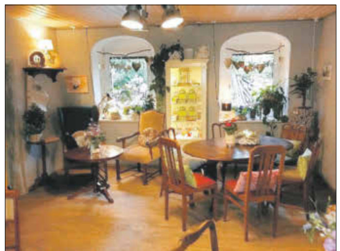
Aus „Angewandter Floristik“ im Blumen-art-Café entsteht ein kleines Kunstwerk für alle Sinne.

Die geschickte Hand der Floristin hat auch das neue Café in dezenter Pracht dekoriert. Ein Sortiment geschmackvoller Accessoires ergänzt das Angebot. Geplant ist für die Sommermonate eine kleine Sitzfläche im Außenbereich.