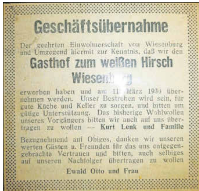
Anzeige 1930 zur Geschäftsübernahme im Weißen Hirsch, Lindenstraße 18 in Wiesenburg

Die Geschichte der Immobilie lässt sich weit länger verfolgen. Das Anwesen in der Lindenstraße 18 (Brandkatasternummer 34) gehört zu den ältesten Wohngrundstücken von Wiesenburg. 1841 maß es 36 Quadratruthen, also rund 740 Quadratmeter. Wann genau diese Siedlungszeile entstanden ist, die sich direkt an der linken Zufahrt zum Schloss und gegenüber vom Rittergut befindet, bleibt noch zu erforschen. Es ist sicher, dass sich nach 1663, als das Amt Wiesenburg von Herzog Philipp Ludwig von Schleswig-Holstein-Sonderburg-Wiesenburg erworben wurde, auch der umfangreiche Hofstaat des Adligen in Wiesenburg niederließ. Für diese Bediensteten mögen die Häuser in der Lindenstraße 16, 18, 20, 22 und 24 wohl erstmals in den 1660er Jahren errichtet worden sein.