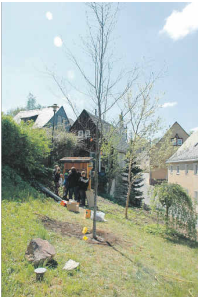
Grundschüler befüllen das neue Insektenhotel. Im Vordergrund die neu gepflanzte Rotbuche.