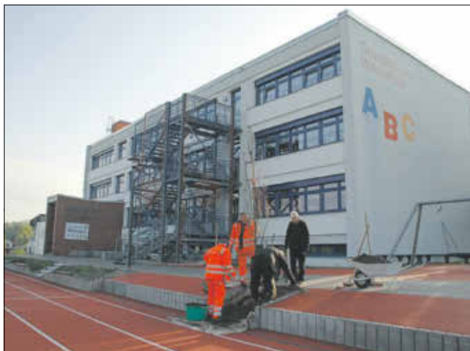
Einer von zwei neu gepflanzten Eichen auf dem Gelände der Grundschule.