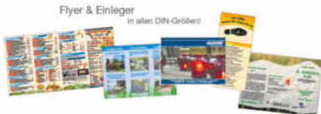
Flyer & Einleger in allen DIN-Größen!