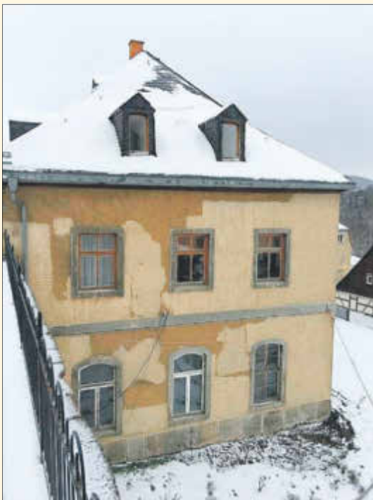
Gebäude Schlossstraße 4 vor der Sanierung: