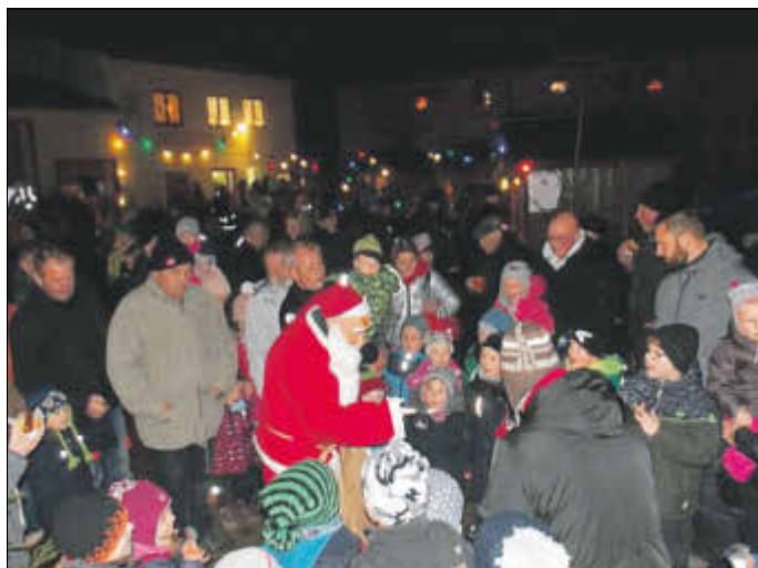
Höhepunkt für die Kleinen: der Weihnachtsmann kommt.

Mitarbeiterinnen dieses Kindergartens organisierten in bewährter Weise wieder die Kaffeestube des Weihnachtsmarktes. Als der Weihnachtsmann schließlich seine Geschenke verteilte, war das Glück der Kleinen perfekt.