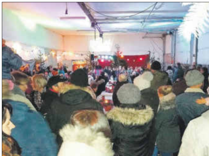
Happy Kids Wiesenburg beim Weihnachtsprogramm am 8. Dezember 2018

Mitarbeiterinnen dieses Kindergartens organisierten in bewährter Weise wieder die Kaffeestube des Weihnachtsmarktes. Als der Weihnachtsmann schließlich seine Geschenke verteilte, war das Glück der Kleinen perfekt.