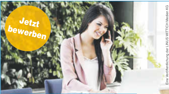
Eine Veröffentlichung der LINUS WITTICH Medien KG

Lokal informiert. Druck. Internet. Mobil.