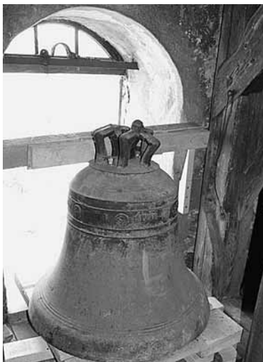
Deutlich zu erkennen ist die im Laufe der Jahrhunderte beschädigte Glockenkronen.

Mit hoher Wahrscheinlichkeit seit 1450 hängt in unserem altherwürdigen Gotteshaus und läutete bis vor kurzem eine Bronzeglocke, die die Stürme vergangener Zeiten überstanden hatte – unsere Marienglocke.