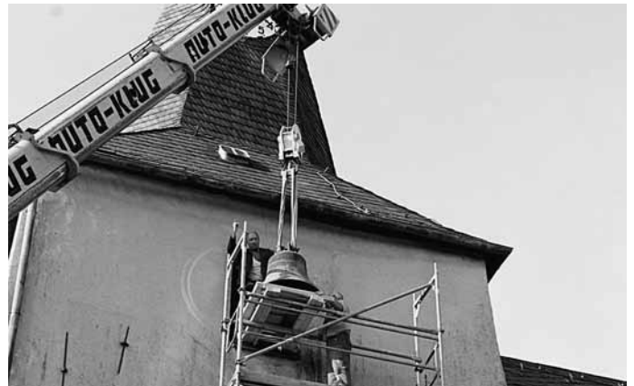
Die Glocke hängt am Haken.