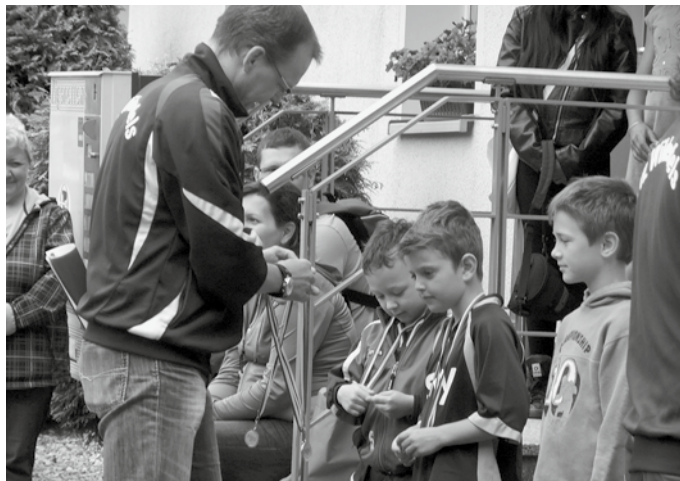
F-Junioren bei der Siegerehrung

Auch diese Spiele waren sehr gut besucht und machten allen viel Spaß.