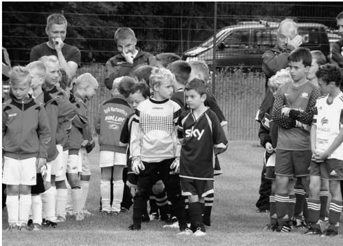
F-Junioren VfL Wildenfels

Das Sportfest wurde mit den Punktspielen der 1. und 2. Männermannschaft erfolgreich beendet. Allen Organisatoren, Helfern und Sponsoren ein großes Dankeschön!