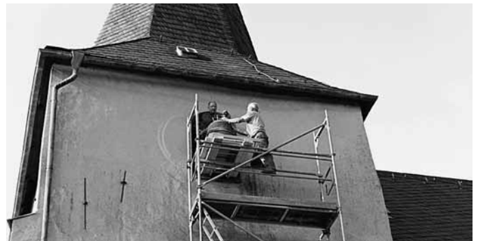
Jetzt steht die Glocke in richtiger Position

Dazu musste die ausgesprochen wertvolle Glocke vom Turm herabgeholt werden.