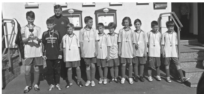
D-Junioren SG Thierfeld-Wildenfels

Unsere D-Junioren konnten auch in der Punktspielsaison 2013/2014 in der Kreisklasse den Staffelsieg erringen. Herzlichen Glückwunsch!