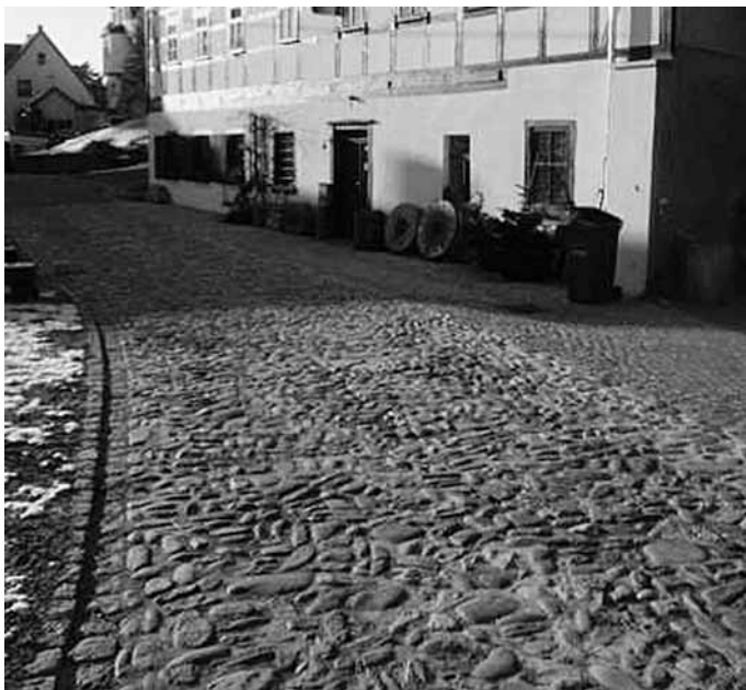
Straßensanierung Siedlung OT Schönau. Muldensteine in ehemaliger ortstypischer Bauweise.

Diesem Bestreben folgend gelang es der ILE-Region „Zwickauer Land“ – bestehend aus 18 Kommunen mit 85 Ortsteilen und ca. 84.000 Einwohnern – in den vergangenen Jahren, eine Vielzahl von Projekten in den Bereichen Bildung, Freizeitangebote für Kinder und Jugendliche, medizinische Versorgung, Barrierefreiheit, energetische Sanierung von Wohn- und Geschäftshäusern u. v. m. zu verwirklichen. Einen kleinen Überblick erzielter Erfolge hier kurz dargestellt – ausführliche Berichte finden Sie auf unserer Website www.zukunftsregion-zwickau.de .