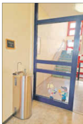
GS Wildenfels, WorksheetCrafter

Die Zeit bis zum Ende der Sommerferien wurde deshalb genutzt, alle Vorbereitungen zur Installation des Brunnes zu treffen, sodass er seit dem ersten Schultag als Wasserspender zur Verfügung steht.